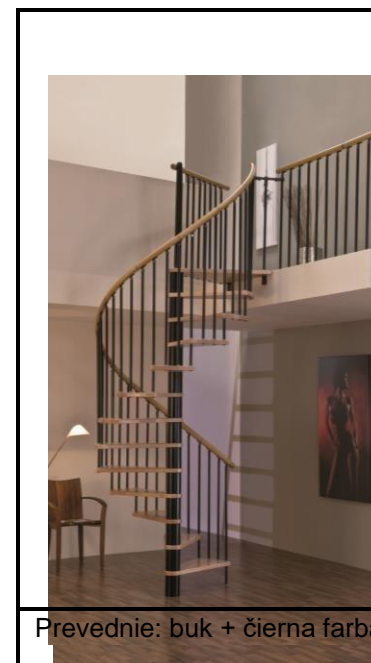
Prevedenie: buk + čierna farba