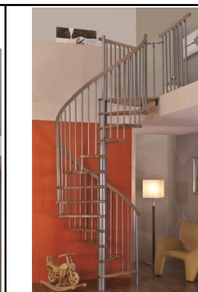
Prevedenie: dub + strieborná farba