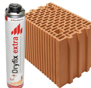
Porotherm 25 Profi Dryfix